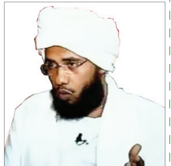
فضيلة الشيخ د. عبد الحادي يوسف

زوجي يصر علي أن أدرس (أحضر الدكتوراه) وأنا في بلد أجنبي ولم أجد مشرفاً لمجالي في جامعة في السودان، ولم تقبلني الأخرى وسألت في مصر وماليزيا.. ولم أنجح. مع العلم بأنني استخرت قبل ذلك كله ورأيت ما أكره ولكني سعيت لأقنعه بأن استخارتي تتماشى مع الواقع. يلوح لي بالطلاق لأنه لا يقبل كلمة (لا) كإجابة!! ويهجرني بالأيام عندما نناقش الأمر ولا يرد