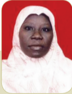
بقلم : قاسم أحمد خليفة