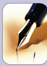
بقلم: أمل محمد أحمد النور

ف عندما تخطط لحياتك مسبقاً ، وتضع لها الأهداف الواضحة يصبح تنظيم الوقت سهلاً وميسراً والعكس صحيح ، فإذا لم تخطط لحياتك فستصبح مهمتك في تنظيم الوقت صعبة. □ لا بد من تدوين أفكارك ، وخطتك وأهدافك على الورق ، وغير ذلك يعتبر مجرد أفكار عابرة ستنساها بسرعة، إلا إذا كنت صاحب ذاكرة خارقة، وذلك سيساعدك على إدخال تعديلات وإضافات وحذف بعض الأمور من خطتك. □ بعد الانتهاء من الخطة توقع أنك ستحتاج إلى إدخال تعديلات كثيرة عليها ، لا تقلق ولا ترم بالخطة فذلك شيء طبيعي. □ الفشل أو الإخفاق شيء طبيعي في حياتنا، لا تياس، وكما قيل : أتعلم من أخطائي أكثر مما أتعلم من نجاحي. □ يجب أن تعود نفسك على المقارنة بين الأوليات ، لأن الفرص والواجبات قد تأتي في الوقت نفسه ، فأيهما ستختار ؟ باختصار اختر ما تراه مفيداً لك في مستقبلك وفي الوقت نفسه غير مضر لغيرك. □ اقرأ خطتك وأهدافك في كل فرصة من يومك. □ استعن بالتقنيات الحديثة لاغتنام الفرص وتحقيق النجاح، وكذلك لتنظيم وقتك، كالإنترنت والحاسوب وغيره. □ لتنظيم مكتبك، غرفتك، سيارتك، وكل ما يتعلق بك سيساعدك أكثر على عدم إضاعة الوقت، ويظهرك بمظهر جميل، فأحرص على تنظيم كل شيء من حولك.