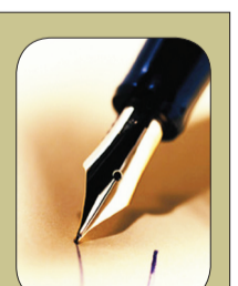
بقلم: سلوى مأمون عبده

يخطئ بعض الناس حينما تكون ثقته بنفسه كبيرة إلى درجة إقحامها في كل قضية . وفي كل حوار وإلى درجة الخوض بها في معارك عقديّة وذلك بالجلوس إلى أصحاب التوجهات المنحرفة . أو الجلوس إلى كتبهم بقصد معرفة ما عندهم . وما وصلوا إليه . أو بقصد الاستفادة من الحق الذي معهم ويستند على مقولة : الحكمة ضالة المؤمن أتى وجدها فهو أحق بها ... ولكن يجب على الإنسان أن ينأى بنفسه عن مجالسة أهل الفسق والضلال امتثالاً لقوله سبحانه وتعالى: ( وَإِذَا رَأَيْتَ الَّذِينَ يَخُوضُونَ فِي آيَاتِنَا فَأَعْرِضْ عَنْهُمْ حَتَّى يَخُوضُوا فِي حَدِيثٍ غَيْرِهِ وَإِمَّا يُنسِيتُكَ الشَّيْطَانُ فَلَا تَقْعُدْ بَعْدَ الذِّكْرَى مَعَ الْقَوْمِ الظَّالِمِينَ )